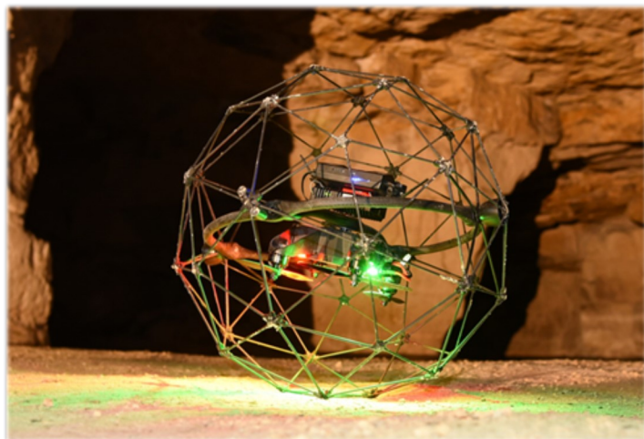
Formation au drone aérien souterrain dans la plateforme d'essais souterrains de l' Ineris

Le drone constitue un maillon technologique supplémentaire au service des experts de l' Ineris , qui peuvent désormais inspecter des zones auparavant inaccessibles et corréler les observations par drone à d'autres données (levés LiDAR et mesures géotechniques notamment).