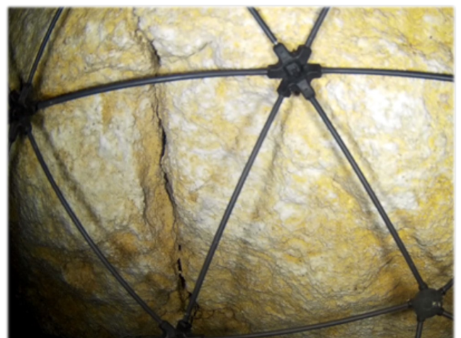
Caractérisation fissurale morphologique, mécanique et hydrologique

Une cavité située à faible profondeur, difficile d'accès et sous des enjeux à protéger, a fait l'objet d'une inspection initiale qui a conclu à la nécessité de suivre périodiquement son état de dégradation. Le drone aérien est utilisé pour renforcer cette surveillance périodique en permettant l'observation et le suivi télédistancé de l'évolution de fissures ouvertes, notamment au regard des infiltrations d'eau potentielles, dans l'attente de travaux de mise en sécurité.