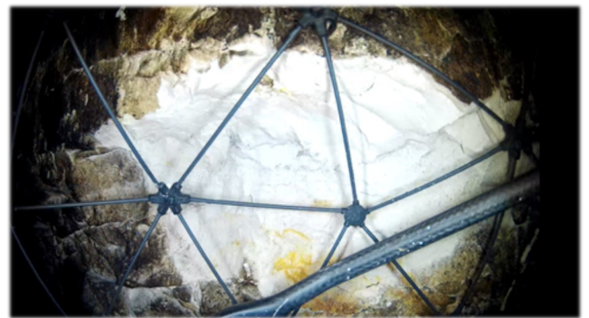
Observation rapide et précise d'une cicatrice d'arrachement en grande hauteur

La partie sommitale d'une cavité en activité est affectée par la chute d'un bloc de faible volume. L'inspection effectuée avec le drone dans un délai court et en toute sécurité met en évidence une fracturation de la craie susceptible de générer un effondrement plus important. Le traitement du secteur, défini et mis en œuvre rapidement, a permis d'éviter un arrêt de l'activité pénalisant économiquement.