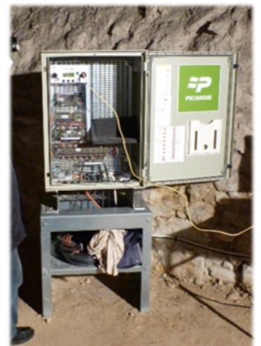
Test de sensibilité d'une centrale d'acquisition acoustique pour la télésurveillance des cavités