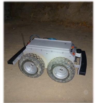
Test de performance d'un drone terrestre pour la reconnaissance des cavités

Disponible sous forme d'un modèle spatial numérique 3D parfaitement positionné, la plateforme offre les conditions idéales pour tester avec précision des technologies de reconnaissance et de télémétrie innovantes telles que les drones. Elle dispose de l'internet et d'une connexion facile à l'infrastructure e.cenaris pour le suivi instrumental d'expérimentations.