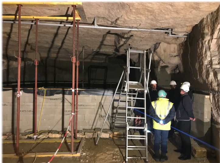
Expérimentation en grand d'un stockage souterrain de chaleur

Un parcours pédagogique explique les enjeux de la prévention du risque cavité. La plateforme offre également un environnement unique de mise en situation pour les formations appliquées et les exercices de sécurité en conditions réelles.