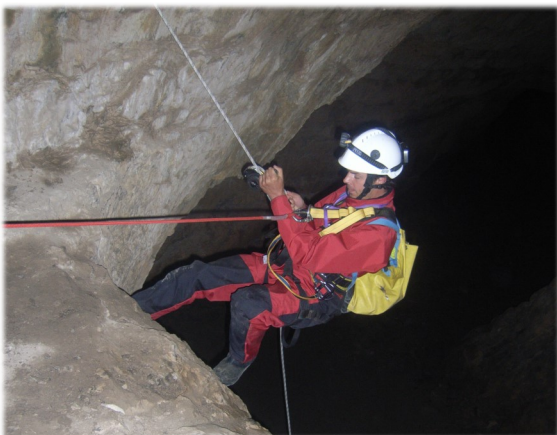
Exercice de sécurité en souterrain par descente en rappel

C 'est pourquoi l'INERIS a développé, à proximité de son site, au cœur de l'ancienne carrière de Saint-Maximin, dans l'Oise, un espace souterrain dédié aux essais géotechniques et à la gestion du risque cavité.